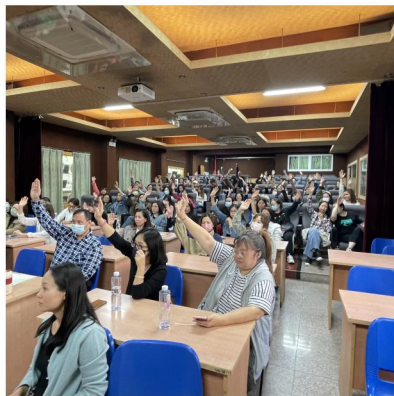
大會現場決議投票